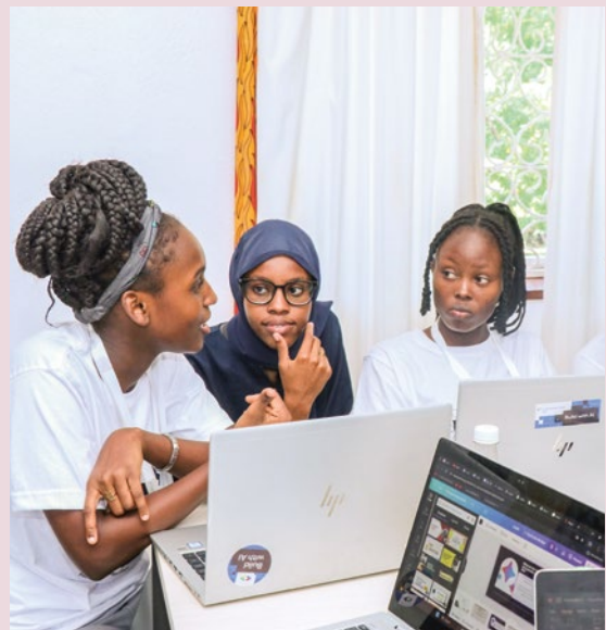
Gruppenarbeit während eines Informatikkurses im Digitech Lab.