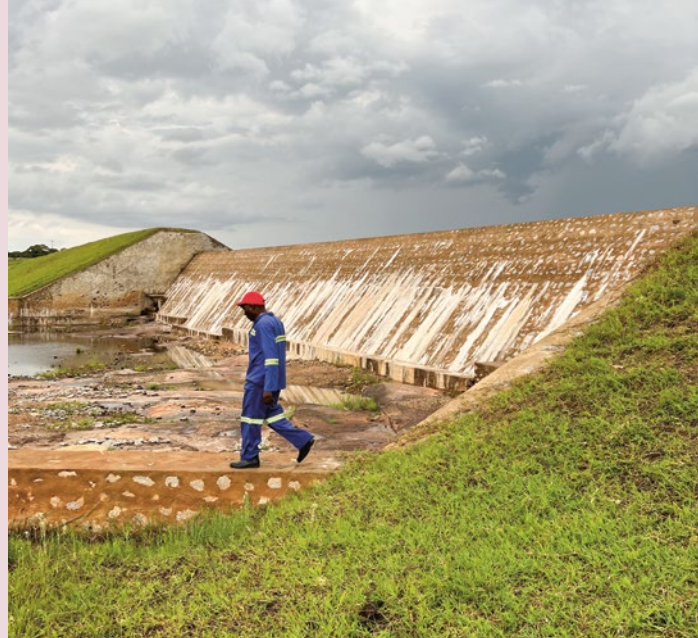
Der grosse Damm von Driefontein wurde komplett saniert und renoviert. Im Bild: ein Arbeiter auf dem Damm.