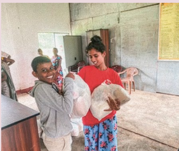
Kinder freuen sich über die Lebensmittel, die dank der finanziellen Unterstützung gekauft werden konnten.